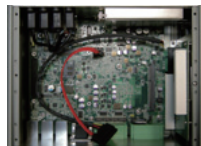
» Fanless Design

All specifications are subject to change without notice.