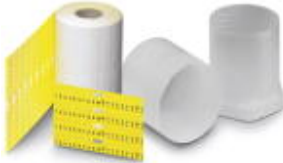
Illustration shows the product TMT 4 R YE

Marker for terminal blocks, can be ordered: By line, white, labeled according to customer specifications, Mounting type: Snap into universal marker groove, Snap into flat marker groove, for terminal block width: 6.2 mm, Lettering field: 6.35 x 6.15 mm