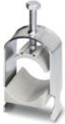
Cable clamp, for DIN rails

Please be informed that the data shown in this PDF Document is generated from our Online Catalog. Please find the complete data in the user's documentation. Our General Terms of Use for Downloads are valid ( http://download.phoenixcontact.com )