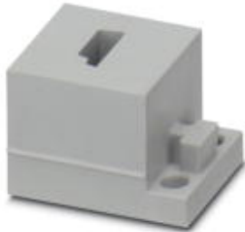
Small, slotted cable sleeves suitable for one AS-i cable, material: SEBS, version: left

Please be informed that the data shown in this PDF Document is generated from our Online Catalog. Please find the complete data in the user's documentation. Our General Terms of Use for Downloads are valid ( http://phoenixcontact.com/download )