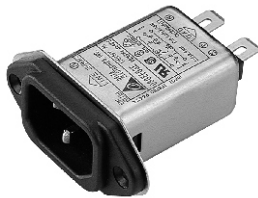
EG3U (With Compact Size)