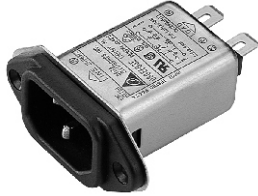
EG3E, EG3Q (Optional soldering lug or wire type)