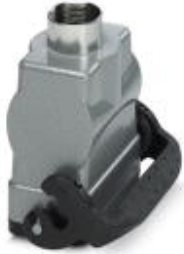
HEAVYCON B10 coupling housing, with single locking latch, height: 77.5 mm, with 1 x Pg21 gland, straight cable outlet

Please be informed that the data shown in this PDF Document is generated from our Online Catalog. Please find the complete data in the user's documentation. Our General Terms of Use for Downloads are valid ( http://phoenixcontact.com/download )