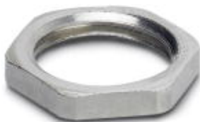
Flat nut with M16 thread

Please be informed that the data shown in this PDF Document is generated from our Online Catalog. Please find the complete data in the user's documentation. Our General Terms of Use for Downloads are valid ( http://download.phoenixcontact.com )