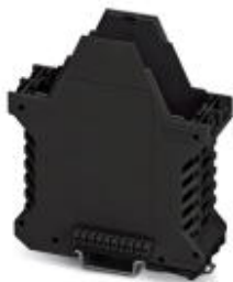
Component housing, length: 99 mm, Lower part, color: black, width: 35 mm, height: 114.5 mm

Please be informed that the data shown in this PDF Document is generated from our Online Catalog. Please find the complete data in the user's documentation. Our General Terms of Use for Downloads are valid ( http://phoenixcontact.com/download )