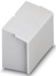
Component housing, color: gray

Please be informed that the data shown in this PDF Document is generated from our Online Catalog. Please find the complete data in the user's documentation. Our General Terms of Use for Downloads are valid ( http://phoenixcontact.com/download )