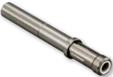
181-075 Socket Terminus