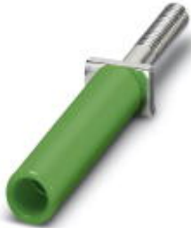
Female test connector, Color: green

Please be informed that the data shown in this PDF Document is generated from our Online Catalog. Please find the complete data in the user's documentation. Our General Terms of Use for Downloads are valid ( http://download.phoenixcontact.com )