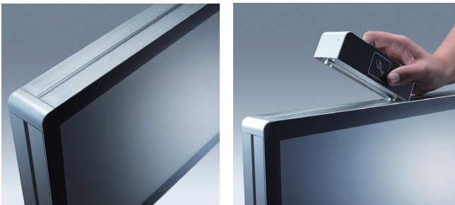
Side groove design for Flexible peripheral device