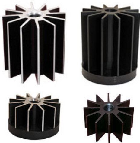
60 mm Diameter & 100 mm Diameter Heat Sinks