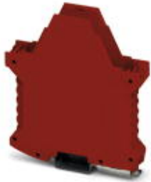
Component housing, color: red

Please be informed that the data shown in this PDF Document is generated from our Online Catalog. Please find the complete data in the user's documentation. Our General Terms of Use for Downloads are valid ( http://phoenixcontact.com/download )