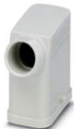
Sleeve housing for single locking engagement nose, lateral cable outlet, for HC-COM-K-KV-PG16 screw connections...

Please be informed that the data shown in this PDF Document is generated from our Online Catalog. Please find the complete data in the user's documentation. Our General Terms of Use for Downloads are valid ( http://download.phoenixcontact.com )