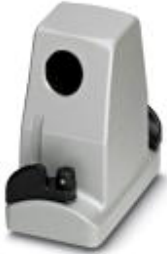
HEAVYCON ADVANCE EMV sleeve housing B10, with bayonet locking, height 100 mm, with 1xM32 thread, lateral cable outlet

Please be informed that the data shown in this PDF Document is generated from our Online Catalog. Please find the complete data in the user's documentation. Our General Terms of Use for Downloads are valid ( http://download.phoenixcontact.com )