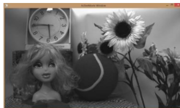
Camera Tool view mode