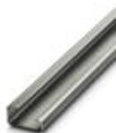
G-profile DIN rail, material: Steel, unperforated, height 15 mm, width 32 mm, length 2 m

DIN rail - NS 32 UNPERF 2000MM - 1201015