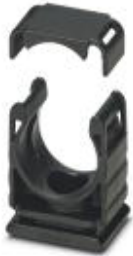
Hose holder with cover

Please be informed that the data shown in this PDF Document is generated from our Online Catalog. Please find the complete data in the user's documentation. Our General Terms of Use for Downloads are valid ( http://phoenixcontact.com/download )