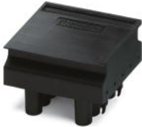
Power bridge, for Inline power-level terminal blocks

Please be informed that the data shown in this PDF Document is generated from our Online Catalog. Please find the complete data in the user's documentation. Our General Terms of Use for Downloads are valid ( http://phoenixcontact.com/download )