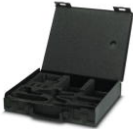
Replacement case, empty

Please be informed that the data shown in this PDF Document is generated from our Online Catalog. Please find the complete data in the user's documentation. Our General Terms of Use for Downloads are valid ( http://phoenixcontact.com/download )