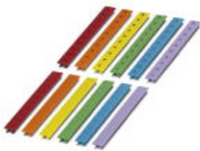
The illustration shows various versions of the article

Please be informed that the data shown in this PDF Document is generated from our Online Catalog. Please find the complete data in the user's documentation. Our General Terms of Use for Downloads are valid ( http://phoenixcontact.com/download )