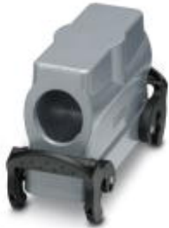
HEAVYCON B24 sleeve housing, with double locking latch, height: 72 mm, with 1 x M32 thread, lateral cable outlet

Please be informed that the data shown in this PDF Document is generated from our Online Catalog. Please find the complete data in the user's documentation. Our General Terms of Use for Downloads are valid ( http://phoenixcontact.com/download )