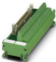
VARIOFACE module, with screw connection and flat-ribbon cable connector, for assembly on NS 35/7.5, 50 positions

Please be informed that the data shown in this PDF Document is generated from our Online Catalog. Please find the complete data in the user's documentation. Our General Terms of Use for Downloads are valid ( http://phoenixcontact.com/download )