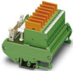
Fuse module with LEDs (for digital input cards of the Delta V control system)

Please be informed that the data shown in this PDF Document is generated from our Online Catalog. Please find the complete data in the user's documentation. Our General Terms of Use for Downloads are valid ( http://phoenixcontact.com/download )