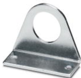
Fixing bracket for protective sleeves, fixed with two screws

Please be informed that the data shown in this PDF Document is generated from our Online Catalog. Please find the complete data in the user's documentation. Our General Terms of Use for Downloads are valid ( http://phoenixcontact.com/download )