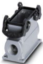
HEAVYCON B16 box mounting base, with double locking latch, height: 84 mm, with 1 x Pg29 gland

Please be informed that the data shown in this PDF Document is generated from our Online Catalog. Please find the complete data in the user's documentation. Our General Terms of Use for Downloads are valid ( http://phoenixcontact.com/download )