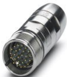
Contact carriers, number of positions: 26

Please be informed that the data shown in this PDF Document is generated from our Online Catalog. Please find the complete data in the user's documentation. Our General Terms of Use for Downloads are valid ( http://phoenixcontact.com/download )