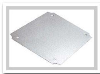
Click on Image for Larger View

Aluminum Internal Panels for AN series boxes. Used to mount customer equipment inside the enclosures. Assembles to mounting bosses on inside of enclosure.