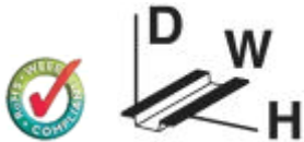
Figure shows PLC-BSC-120UC/21-21/SO46 version

14 mm PLC basic terminal block with screw connection, without relay or solid-state relay, for mounting on DIN rail NS 35/7,5, 2 PDTs, input voltage 230 V AC/DC