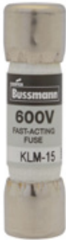
600Vac/dc 1 to 30A