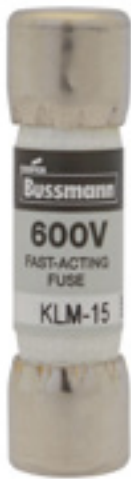
600Vac/dc 1 to 30A