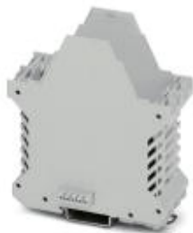
Component housing, length: 99 mm, color: light gray

Please be informed that the data shown in this PDF Document is generated from our Online Catalog. Please find the complete data in the user's documentation. Our General Terms of Use for Downloads are valid ( http://phoenixcontact.com/download )