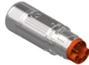
Contact Arrangement mating view

H 52 A 008 NN 00 42 0100 000 H K A 008 N 00 42 0100 000