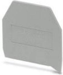
End cover, Length: 43 mm, Width: 1.5 mm, Color: gray

Please be informed that the data shown in this PDF Document is generated from our Online Catalog. Please find the complete data in the user's documentation. Our General Terms of Use for Downloads are valid ( http://phoenixcontact.com/download )