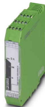
Illustration shows the 24 V design

http://eshop.phoenixcontact.de/phoenix/treeViewClick.do?UID=2900531