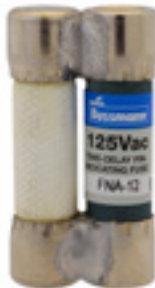
125Vac 12 to 15A