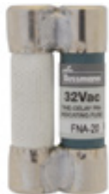
32Vac 20 to 30A