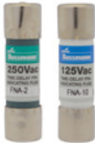
250Vac 1/10 to 6A 125Vac 6-1/4 to 10A