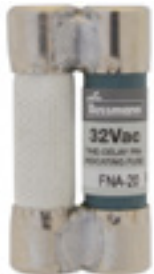
32Vac 20 to 30A