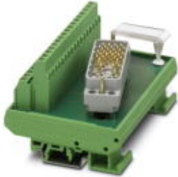
VARIOFACE module, for ELCO connector, for mounting on NS 35/7.5 or NS 32, with pin strip 8016 left, no. of positions 32

Please be informed that the data shown in this PDF Document is generated from our Online Catalog. Please find the complete data in the user's documentation. Our General Terms of Use for Downloads are valid ( http://phoenixcontact.com/download )