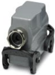
HEAVYCON B24 sleeve housing, with double locking latch, height: 72 mm, with 1 x M32 screw connection, lateral cable outlet

Please be informed that the data shown in this PDF Document is generated from our Online Catalog. Please find the complete data in the user's documentation. Our General Terms of Use for Downloads are valid ( http://phoenixcontact.com/download )