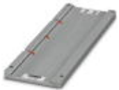
Magazine, for CMS-P1-PLOTTER, for accommodating UC-EMP..., UC-EMLP...