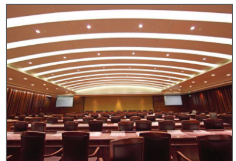
LED panel-lighting applications