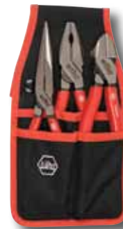
Durable Canvas Belt Pack Pouch