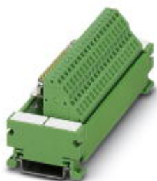
VARIOFACE module, with spring-cage connection and D-Subminiature socket strip, for mounting on NS 35/7.5, 9-pos.

Please be informed that the data shown in this PDF Document is generated from our Online Catalog. Please find the complete data in the user's documentation. Our General Terms of Use for Downloads are valid ( http://phoenixcontact.com/download )