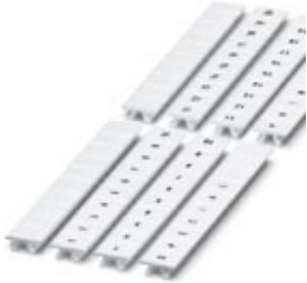
Zack marker strip, 10-section, horizontally labeled with the consecutive numbers: 201 ... 210, white, width: 8 mm

Please be informed that the data shown in this PDF Document is generated from our Online Catalog. Please find the complete data in the user's documentation. Our General Terms of Use for Downloads are valid ( http://phoenixcontact.com/download )