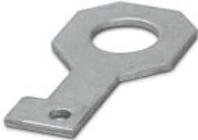
Plate for fixing the FLT-ISG-100-EX isolating spark gap to a flange, drill hole diameter of 36 mm.

Please be informed that the data shown in this PDF Document is generated from our Online Catalog. Please find the complete data in the user's documentation. Our General Terms of Use for Downloads are valid ( http://phoenixcontact.com/download )