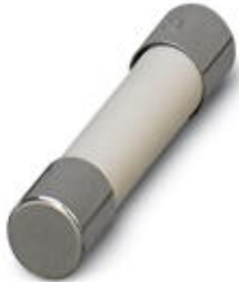
Output fuse (5x20 mm) acc. to IEC 127-2/EN 60127-2, 2 A fast blow

Please be informed that the data shown in this PDF Document is generated from our Online Catalog. Please find the complete data in the user's documentation. Our General Terms of Use for Downloads are valid ( http://phoenixcontact.com/download )