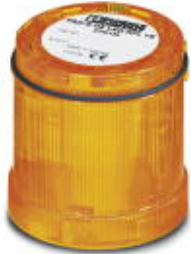
LED random flashing beacon element, 24 V DC, yellow

Please be informed that the data shown in this PDF Document is generated from our Online Catalog. Please find the complete data in the user's documentation. Our General Terms of Use for Downloads are valid ( http://phoenixcontact.com/download )