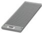
Plastic magazine for CMS-P1 plotter. Accepts 22 Zack band strips